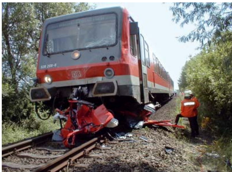
Abb. 7: Person vor Zug: Möglicherweise Anlass für ein Debriefing – zur Teilnahme darf jedoch niemand gezwungen werden

helfen können, geeignete Anbieter von Einsatznachsorgemaßnahmen ausfindig zu machen, steht jedoch seit 2005 (in 15) zur Verfügung.