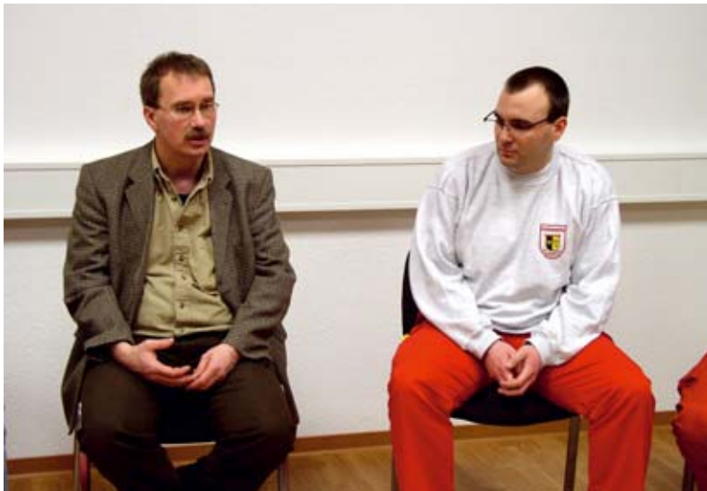
Abb. 4: Debriefings werden von psychosozialen Fachkräften und speziell geschulten Peers geleitet

Darüber hinaus ist ein Gespräch in einer Gruppe sicherlich schwieriger zu moderieren als ein Einzelgespräch. Man kann nicht so intensiv und individuell auf jeden einzelnen eingehen, so dass persönliche Bedürfnisse vielleicht nicht ausreichend beachtet werden.