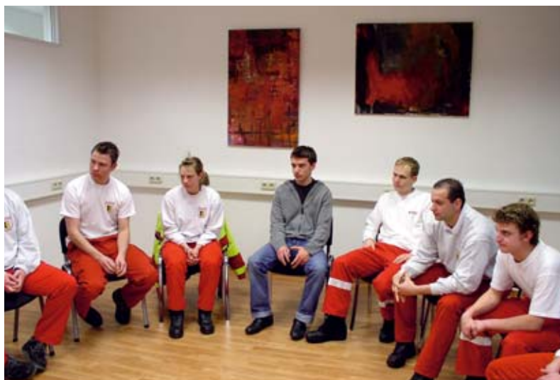
Abb. 8: Der kollegiale Austausch steht im Vordergrund – Debriefing ist keine Psychotherapie!

Debriefings möglichst sachlich dargestellt und ausführlich erläutert werden. Helfer sollten die laufende Debriefing-Diskussion verstehen und nachvollziehen können, sie müssen dementsprechend informiert und aufgeklärt werden. Vielleicht kann dieser Artikel einen Beitrag dazu leisten.