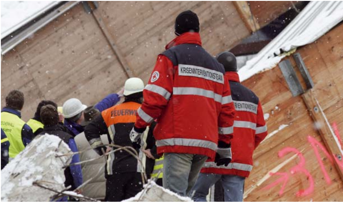
Abb. 5: Auch am Einsatzort kann eine psychosoziale Unterstützung für die Helfer erfolgen – Debriefings finden jedoch frühestens 24 Stunden nach dem Einsatzende statt

der Symptome. Da in einem Debriefing immer auch Informationen über Belastungsreaktionen vermittelt werden, könnte es sein, dass sie anschließend eher erkannt und vielleicht auch besser verstanden werden. Wer entsprechend aufgeklärt ist, weiß die eigene Befindlichkeit besser einzuschätzen und achtet mehr auf sich (25).