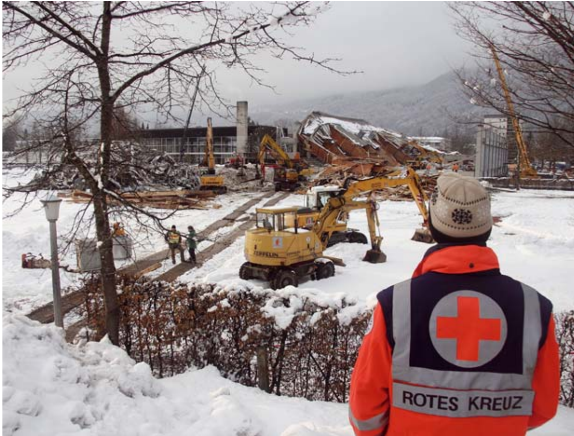
Abb. 2: Mit den belastenden Eindrücken allein?

Inzwischen liegen viele Einzelstudien und mehrere Metaanalysen vor. Dennoch sind die Forschungsergebnisse weder eindeutig noch einheitlich (12): „Obgleich die Methode inzwischen weltweite Aufmerksamkeit und Verbreitung ge-