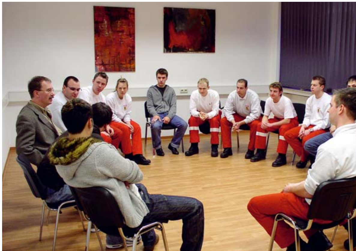
Abb. 3: Debriefings finden in einem ruhigen Raum statt, die Sitzordnung ist vorgegeben

es insgesamt vorhersehbar; kein Teilnehmer muss „die Katze im Sack kaufen“ – vorausgesetzt, die Standards sind ausreichend bekannt. Bei Großschadenslagen kann eine