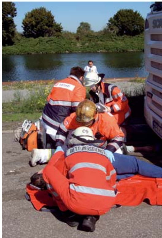
Abb. 6: In einem späteren Debriefing können sich die Helfer darüber austauschen, wie sie den Einsatz erlebt haben

Zu beachten sind allerdings auch die Ergebnisse der bislang größten in Deutschland durchgeführten Untersuchung zur Wirksamkeit sekundärpräventiver Nachsorgemaßnahmen. In dieser Studie der Ludwig-Maximilians-Universität in München konnte zwar keine positive, aber eben auch keine schädigende Wirkung von Debriefings nachgewiesen werden (12).